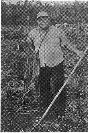
写真 2 マヤ族の農民

予定地の材積表と樹種のデータを集める。それをコンピュータに入力し解析する作業をこなし、樹種別の分布表や色分けされた地図を作成する。伐採は4～5月にかけて、製材は農閑期の10月以降にかけて行われ、村全体で年間約700万円の売上げがあるという。