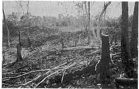
写真 1 伝統的な焼畑

キンタナロー州はユカタン半島の東側を占め、カリブ海に面した中部の一部はシアンカン自然保護区に指定されており、ユネスコが推奨する世界遺産の一つとして登録されている（図1）。また、メキシコの中でも、未だ大規模の森林地帯が残っているところとして知られており、南の国境をグアテマラやベリーズと分かち合う3国にまたがる地帯は、メソ・アメリカにおいてアマゾンに次いで2番目に大きな熱帯林が残されているところとして注目されている。