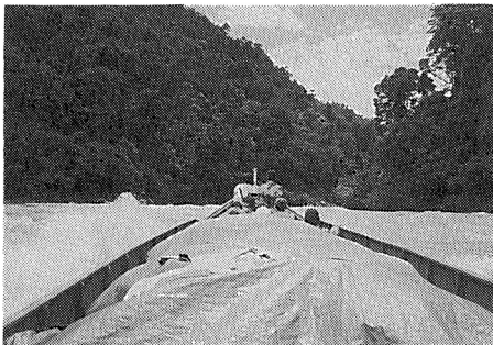
写真 2 カヤン川上流部の激流

雨が降り始め、双発のプロペラ機は、積乱雲に突っ込んで行くかのようにサマリンドア空港をあとにした。飛行機は乱気流に見舞われるたびに急降下し、気分を悪くする人が続出した。さしずめ空の難所といったところだろうか。実際たまたま墜落するらしいことを後で聞いて怖くなった。しかし、雲が切れ、視界が開けると、見渡す限りの樹海が眼下に広がった。一箇所