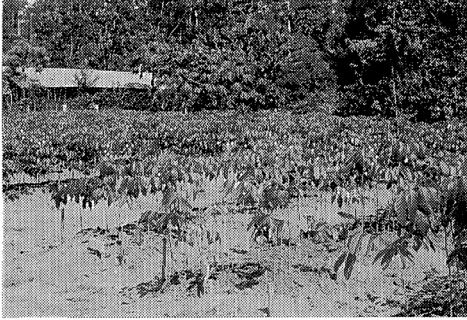
写真 2 山出し直前のマホガニー苗木 (AVH 国有林)