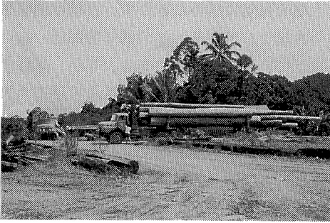
写真 4 モデル森林経営プロジェクトの対象地域において伐採された丸太の輸送 (サラワク)

すると共に、その実現のためのサラワク州の取組を国際社会が支援すべき、との勧告を行った。この勧告の趣旨を踏まえて開始された ITTO プロジェクトが、「総合保護地域としてのランジャク・エンティマウ野生生物サンクチュアリの開発（ランジャクプロジェクト）」、「水源管理の視点からの丘陵フタバガキ科林経営基準の研究（水源管理プロジェクト）」及び