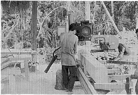
写真 3 移動式製材機械による製材 (AVH 国有林)

の樹種のみを対象として極めて選択的な伐採を行った。この結果、調査の際に予定したごく一部の立木が伐採されたのみであった。これにより、伐採収入が予定を大幅に下回ることとなった。