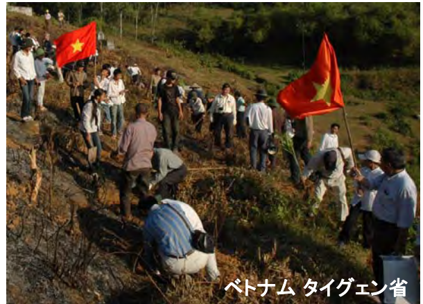
ベトナム タイグエン省