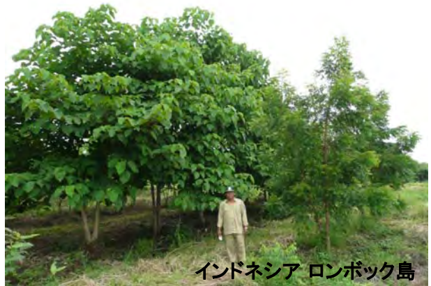
インドネシア ロンボック島