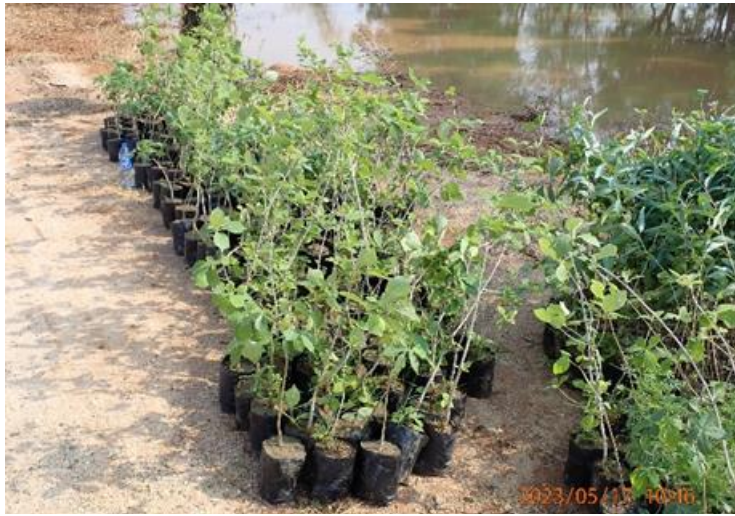
補植用の苗木（レバンデ村）