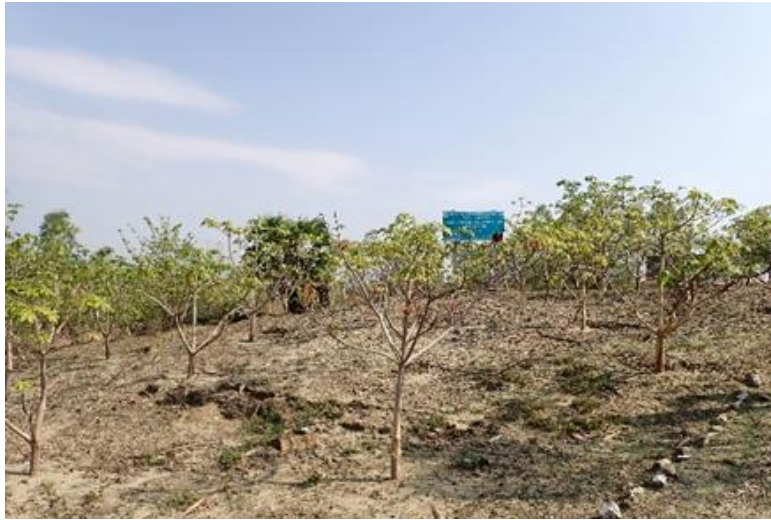
ステルクリア (ラトケ・テトランカン村)