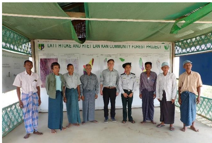
ラトケ・テトランカン村の住民