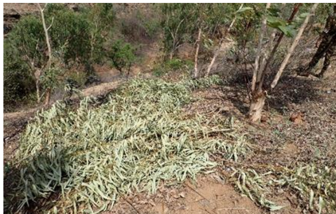
燃料として利用するために伐採された枝（運搬のために乾燥させている）（カバニ・コミュニティフォレスト）