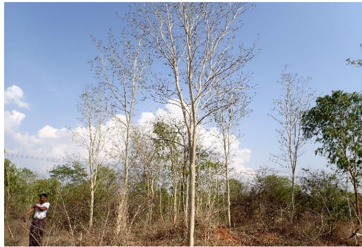
S.P.K.コミュニティフォレスト