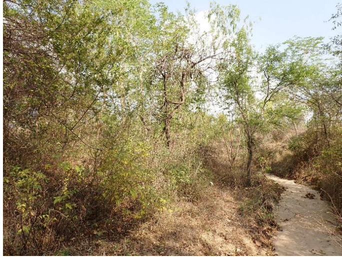
沢筋の植生回復状況 (S.P.K コミュニティフォレスト)