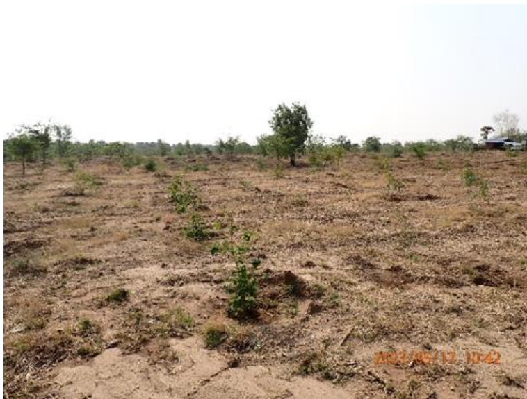
レバンデ村の植栽状況

なお、植栽に従事しているのは男性のみで、女性は家の近くで農業に従事しているとのことであった。