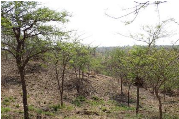
アカシア・カテチュー (ラトケ・テトランカン村)