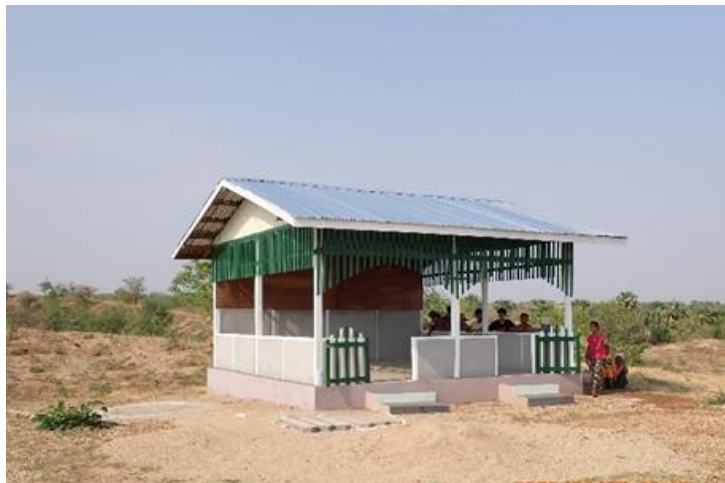
休憩小屋（レバンデ村）