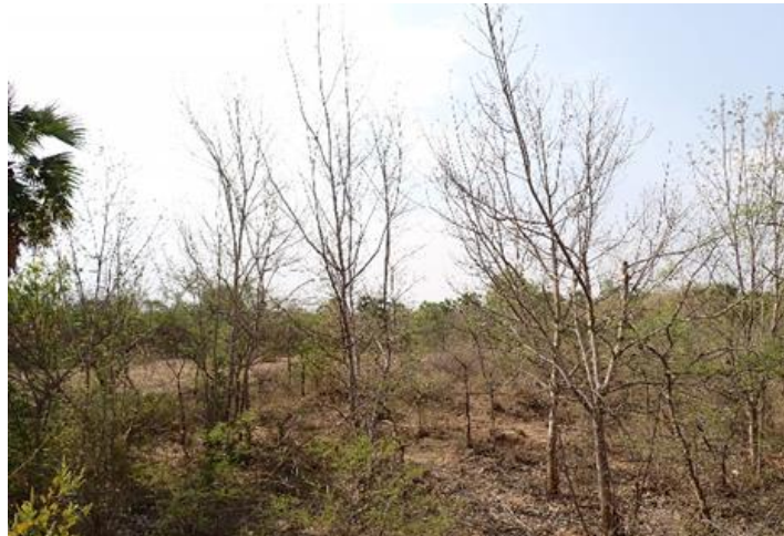
S.P.K.コミュニティフォレスト