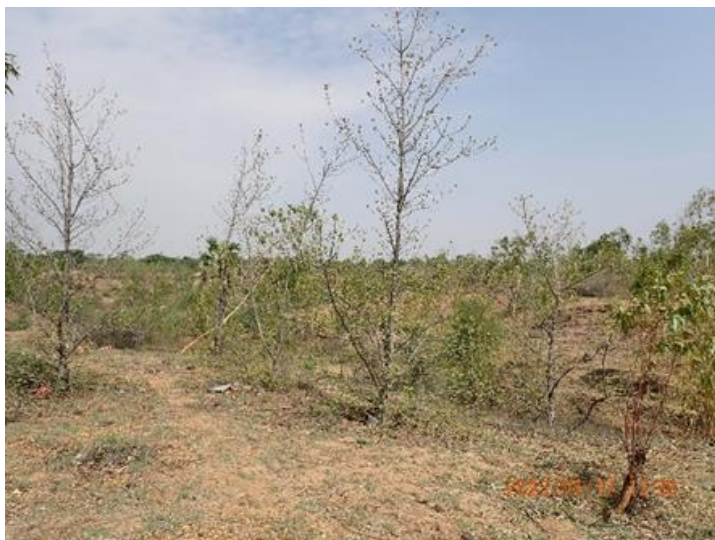
ビルマチーク (カバニ・コミュニティーフォレスト)

本箇所は、ユーカリ、ビルマチーク、ニーム、コッコ ( Albizia lebbek )の複数樹種を植栽している。植栽後 10～15 年が経過しているが、良く成林していた。本林分は、近隣の村で、河川の氾濫により移住をせざるを得なかった村の村人により、燃材として使用されているとのことである。ユーカリの枝が伐採されているところ、また、過去に伐採されたユーカリが萌芽更新により、更新している状況を確認した。