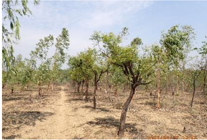
カバニ・コミュニティフォレスト