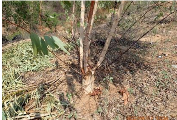
ユーカリの萌芽更新（カバニ・コミュニティフォレスト）