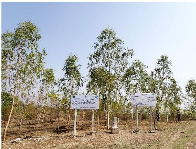
ユーカリ（ラトケ・テトランカン村）

住民からの聞き取りを行ったところ、ラトケ・テトランカン村の住民は、豆、ゴマ、トウモロコシなどを栽培し、牛も飼っている。村の近傍に少しだけ木を植えているが、植林に携わるのは実質的に本プロジェクトが初めてとのことであった。植林の意義と課題については、今後植林木が成長すれば、家の材料としてポールを採取したり、ステルクリアからの樹脂（カラヤゴム）の採取による収入を期待している、植生に緑が回復していくことも大事であり、今後も植林を続けたい、課題としては、下草（雑草）の繁茂であり、下刈りを十分に行わないと火が入ってしまうとのことであった。