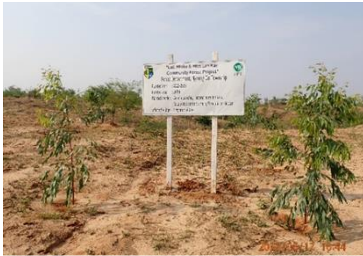
レバンデ村の植栽状況