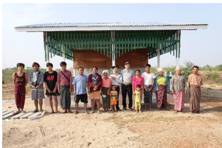
レバンデ村の村人