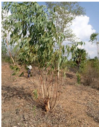
伐採利用後の萌芽更新状況 (S.P.K コミュニティフォレスト)